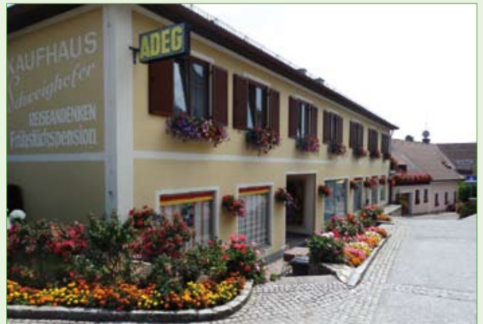
2 Floras Kaufhaus Schweighofer-Derler