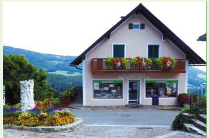
3 Floras für Kaufhaus Töglhofer