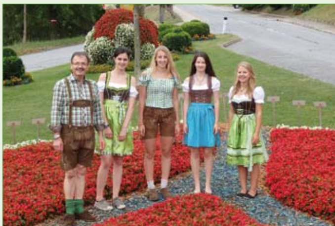
Unsere Ferialpraktikanten bei der Präsentation des Blumendorfes Pöllauberg für die Blumenjury

4 ausgesprochen hübsche Damen haben im Sommer 3 Wochen lang im Gemeindedienst ihre Ferialarbeit frisch, froh und heiter absolviert. Ob im Reinigungsdienst, bei der Kinderbetreuung, im Gemeindeamt oder bei den Freizeittagen, sie haben ganze Arbeit geleistet!