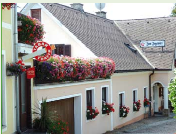
Gasthof Goger: 2 Floras