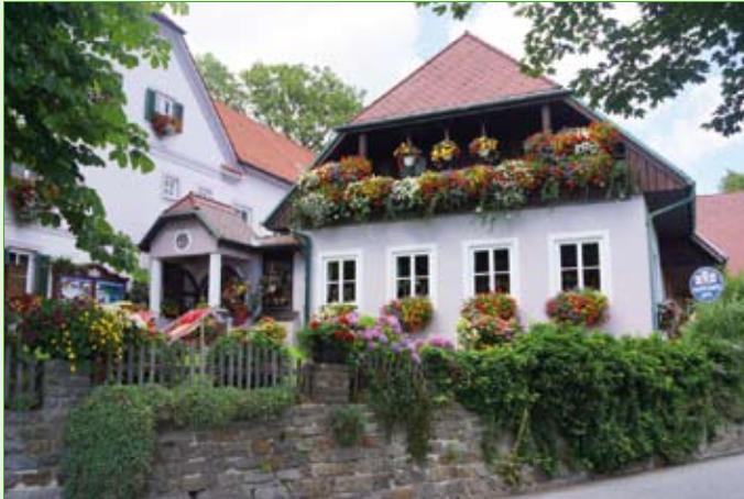
Bereits zum 10. Mal Gold: Berggasthof König

Sieger (5 Floras) in der Kategorie Gaststätten und Hotels