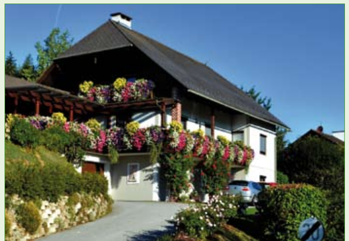
Bronze für Familie Ebner