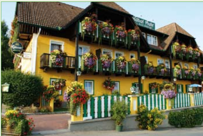
Bereits zum 5. Mal Gold: Waldhof Muhr