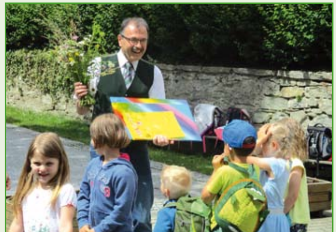
Gratulation zum Geburtstag