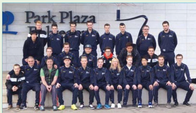
Spieler der KM I und KM II beim Trainingslager in Medolin.