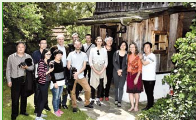
Am Foto sehen wir sehr erfreute Gesichter beim Zeil-Kratzer

Eine Chinesische Delegation war zu Besuch im Bezirk und auch am Pöllauberg und staunte über äußerst innovative LEADER-Projekte. So wurden auch die Landlust Häuser im Pöllauer Tal besichtigt.