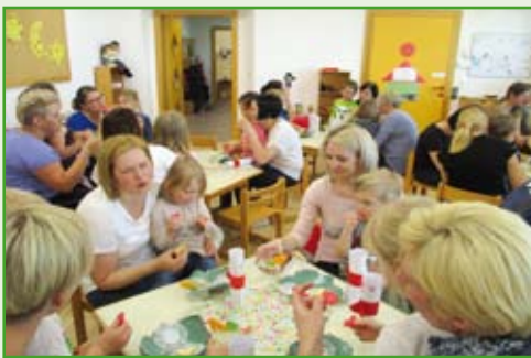
N ach der Bewegung wurden die Mamas von ihren Kindern zu einer kleinen Stärkung eingeladen