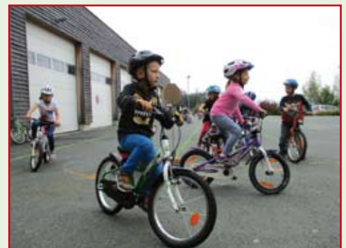
V iel Ausdauer und Geschicklichkeit hatten die Kinder beim Fahrradfahren