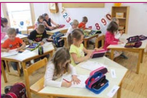
F inger und Hände bewegen sich beim Schulespielen