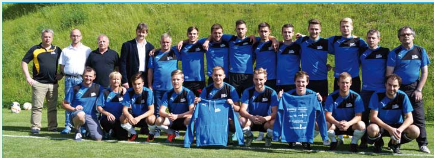
Sponsoring Trainingsbekleidung für Kampfmannschaft