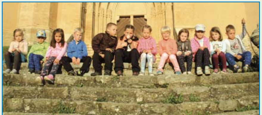
D ie Sonnenkinder beim Abendspaziergang vor der Kindergartennacht...