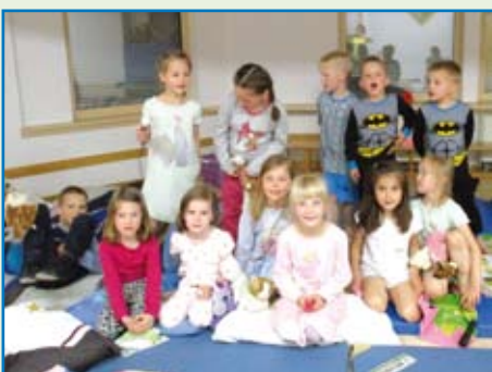
...und danach machen wir uns bereit für's Schlafen