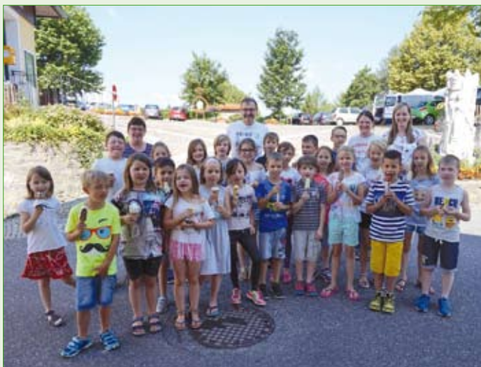
Für die Schul- und Kindergartenkinder gab es als Danke für Gesangsdarbietungen erfrischendes Eis!