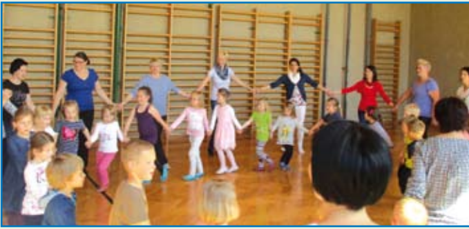
E ine bewegte Muttertagsfeier im Volksschulturnsaal

Zum Jahresthema „1 2 3 im Sauseschritt viel Bewegung hält uns fit“ gab es im Frühling noch einige interessante, lustige und vor allem bewegungsfreudige Aktivitäten. Damit ist auch wieder ein erlebnisreiches, sportliches Kindergartenjahr zu Ende und wir wünschen den „12 Sonnenkindern“ viel Spaß, Freude und Erfolg für die Schule. Allen anderen Kindern und deren Eltern wünschen wir einen erlebnisreichen, bewegungsfreudigen aber auch erholsamen Sommer.