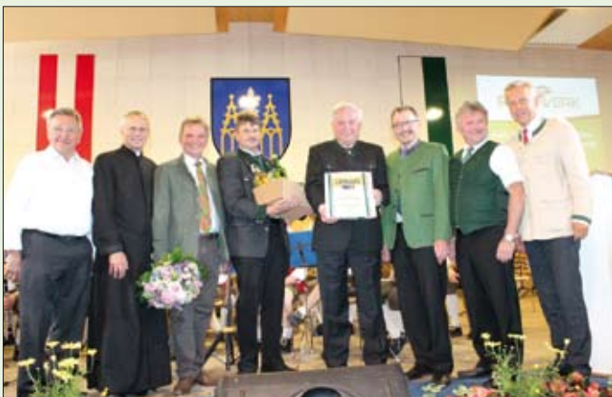
Verleihung der Ehrenbürgerschaft an Landeshauptmann Schützenhöfer

Zusätzlich wurde die Naturparkarena in den Wintermonaten in den letzten 10 Jahren ca. 700 mal zum Hallenfußball genutzt. Ein großes DANKE unseren Vereinen, die das gesellschaftliche Leben am Pöllauberg mit gestalten! Auf all das können wir besonders stolz sein.