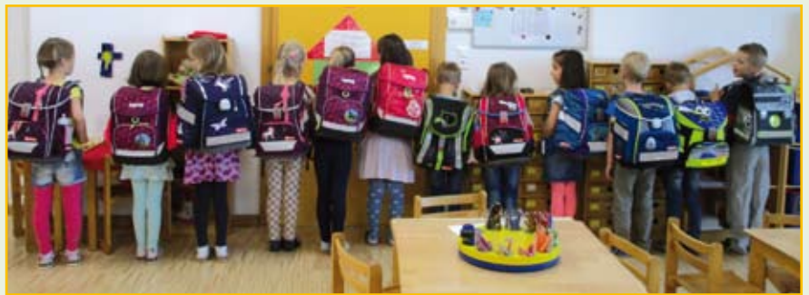
D ie 12 Sonnenkinder präsentieren stolz ihre Schultaschen