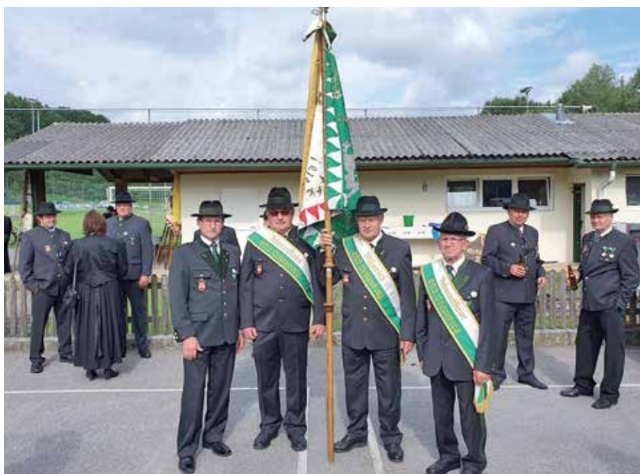
1. Ausfahrt des Kameradschaftsbundes Pöllauberg im kleinen Rahmen zum Bezirkstreffen nach St. Margarethen an der Raab