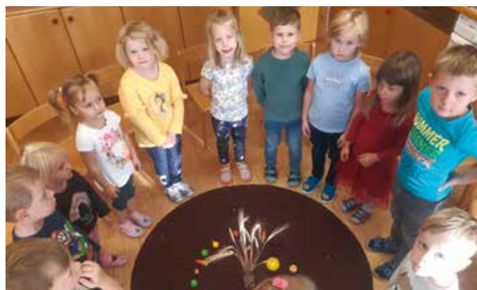
Im Sesselkreis legten die Kinder ein Mandala zum Thema "Erntedank".