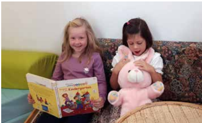
In unserer Bilderbuchecke ist es sehr gemütlich.