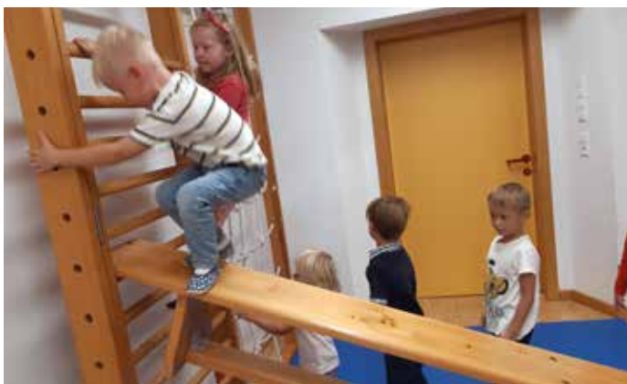
Im Turnsaal klettern die Kinder ganz hoch hinauf.