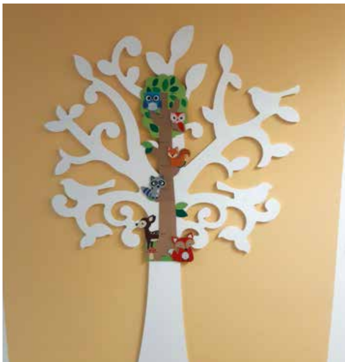
Unser neuer WACHSTUMSBAUM zeigt uns, wie groß die Kinder sind.