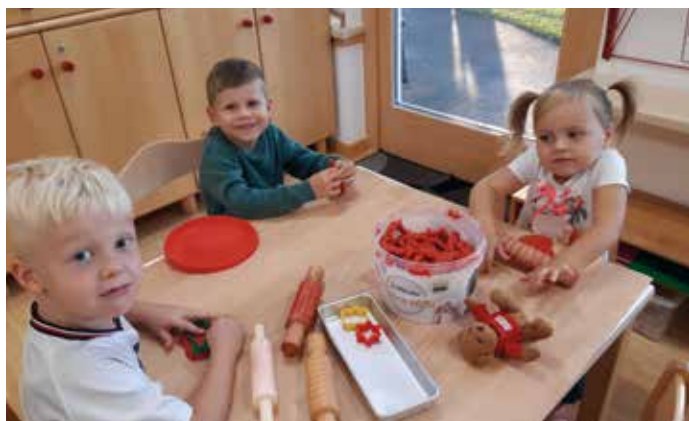
Beim Plastilinkneten entstehen tolle Figuren.