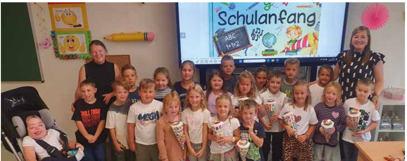
Die Kinder der 1. Schulstufe und der gesamten 1. Klasse mit ihren Lehrerinnen.