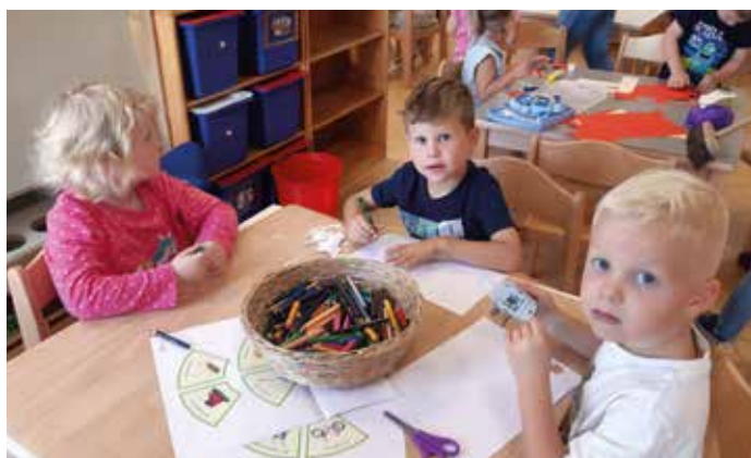
In der Bastelecke sind die Kinder sehr kreativ.