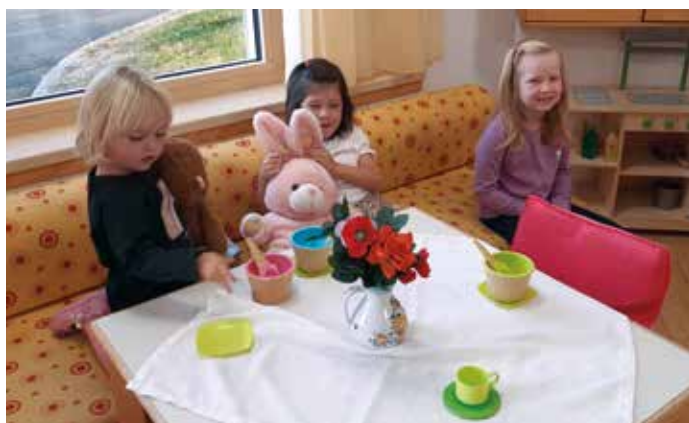
In der Puppenecke wird das Familienleben nachgespielt.

Zu Beginn des Kindergartenjahres lernen wir neue Freunde kennen und beobachten die Natur im Herbst.