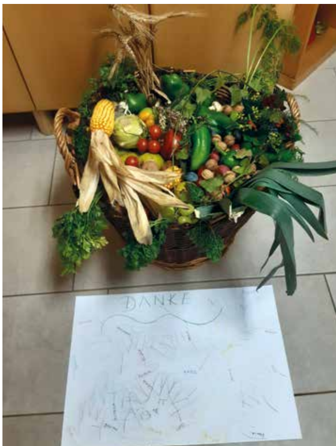
Beim Erntedankfest im Kindergarten dankten wir Gott für die Früchte unserer Erde und brachten einen Korb mit Erntegaben in die Kirche.