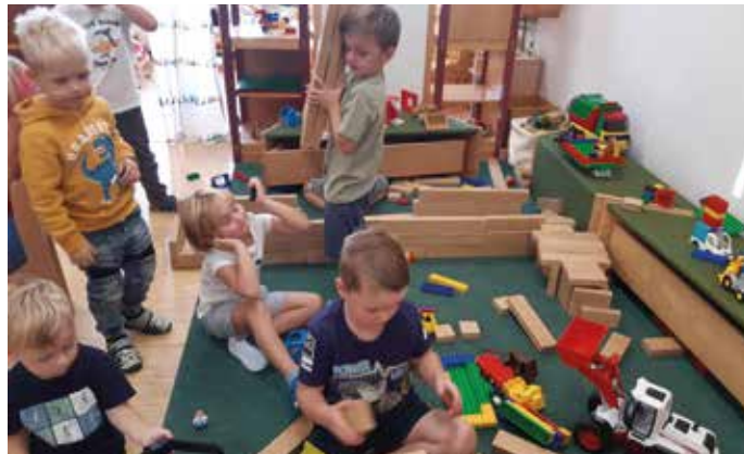
In der Bauecke sind unsere zukünftigen Baumeister zu sehen.